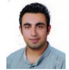
Berdan DOĞU Tekniker

0348 811 2666-1308 veysel_bolat@kilis.edu.tr